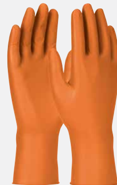
Grippaz® Engage de PIP® tailles P - 3TG

% d'économies réalisées en passant à l'usage prolongé plutôt qu'à l'usage unique : 46%