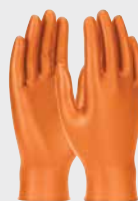
Grippaz® Skins GP67256, 6 mil