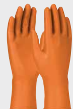
Grippaz® Engage GP67307, 7 mil