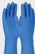
Grippaz® Food Plus GP67308, 8 mil

LES GANTS À USAGE PROLONGÉ OFFRENT LA DEXTÉRITÉ ET LE CONFORT D'UN GANT À USAGE LÉGER ET LA DURABILITÉ NÉCESSAIRE À UNE GRANDE VARIÉTÉ D'APPLICATIONS INDUSTRIELLES