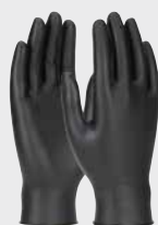
Grippaz® Skins GP67246, 6 mil